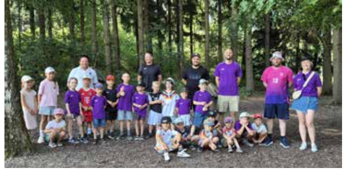
Bambini Ausflug Wildpark Poing